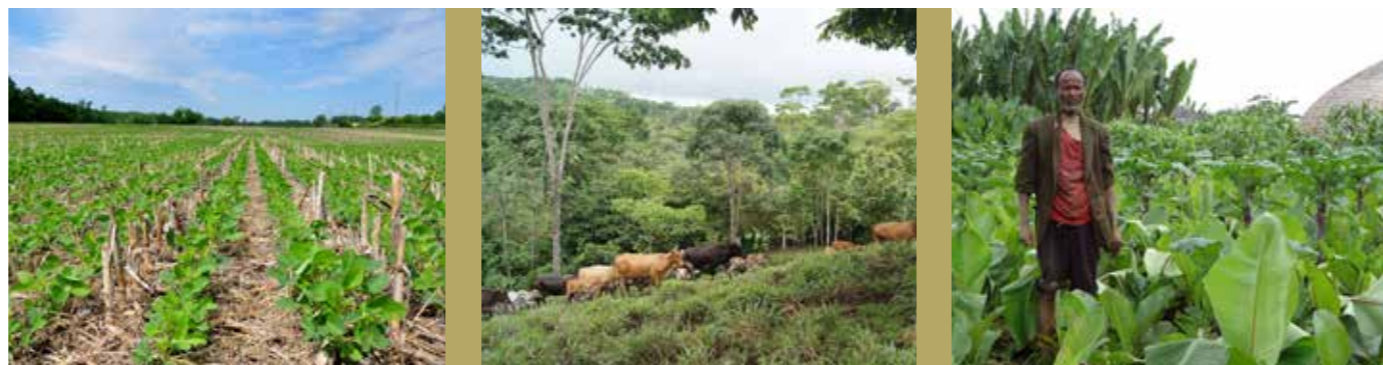
Estados Unidos

Iniciativas y recursos tales como el Panorama mundial de enfoques y tecnologías de la conservación (WOCAT, por sus siglas en inglés), TerrAfrica, el manual de referencia del Banco Mundial y las Directrices voluntarias para la gestión sostenible de los suelos (DVGSS) proporcionan ejemplos detallados de conceptos y prácticas locales de GST. La combinación de prácticas que abordan la conservación del agua y los suelos, la diversificación de los sistemas de cultivo, la integración de sistemas de cultivos y ganado y la agrosilvicultura son las más efectivas y deben fomentarse. Los usuarios de las tierras, los administradores y otras partes interesadas deben identificar las combinaciones locales óptimas de las prácticas de GST para cada tipo de uso de la tierra (tierras de cultivos, pastizales, bosques/tierras boscosas, tierras mixtas u otras clases de uso de tierra, tales como minas o asentamientos humanos). Ejemplos de grupos de tecnologías de GST son: gestión integrada de fertilidad del suelo, perturbación mínima del suelo, control de la erosión de los suelos, gestión de la vegetación, gestión del agua, reducción de la deforestación, entre otros.