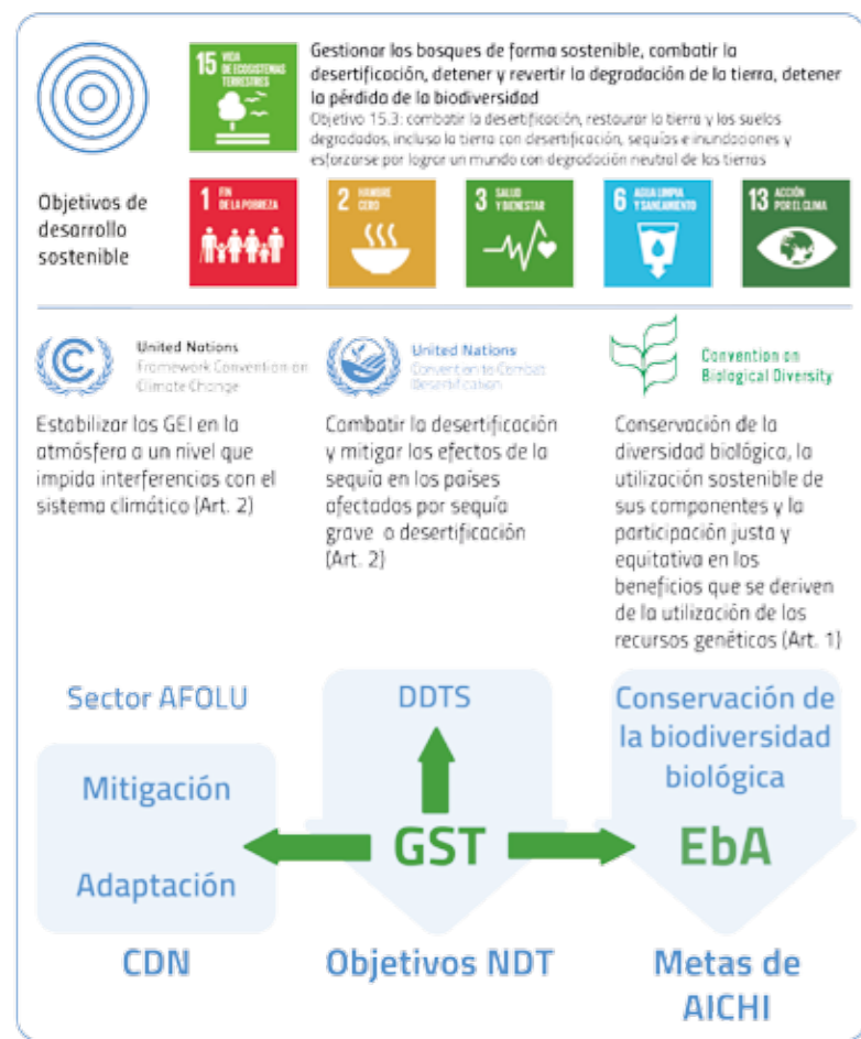
Figura 2: Contribución de la GST a los objetivos de las tres Convenciones de Río como nexo entre diversos ODS.

y tiene un gran potencial para contribuir a la adaptación y mitigación del cambio climático, tal como se define en ODS 13 (acción por el clima). Hay cada vez más ejemplos de GST que brindan oportunidades económicas, por ejemplo a través de menos necesidad de uso de fertilizantes y pesticidas, la reducción de daños por la erosión del suelo, los rendimientos estables de los cultivos y a través del desarrollo de comercio sostenible basados en la producción y consumo responsables.